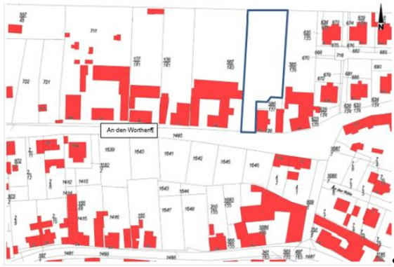
Lageplan aus Bekanntmachung vom 20.09.2017 des Aufstellungsbeschlusses 064/2017

Der Aufstellungsbeschluss wird daher nicht mehr benötigt und kann aufgehoben werden.